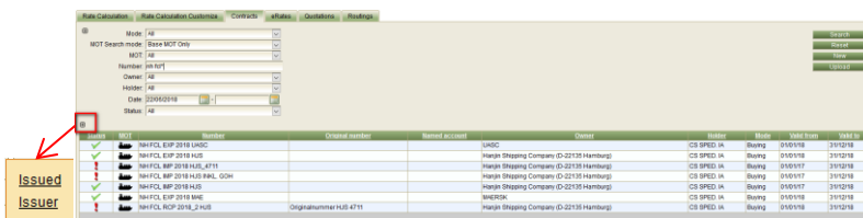
CONTRACTS: HINZUFÜGEN VON ISSUED UND ISSUER